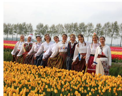
Hollandi naistantsurühm Tuuletütred

tantsupäeva . Naisrühm “Tuuletütred” ja sõbrad tähistasid Tantsupäeva 28. aprilli õhtul Amsterdamist 15 km kaugusel, Hoofdorpi linna lähedal, millele järgnes ühine istumine tee/kohvi ning koogiga. Aprillikuus on Hollandis lillepõllud suur vaatamisväärsus nii turistide seas kui ka Hollandi enda rahva silmis.