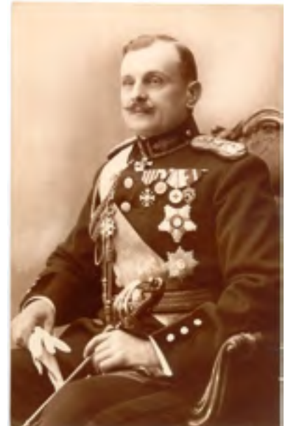
Jaan Soots.