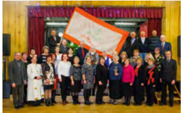
Kanepi Meeskoori üldlaulupeo lipp (1869). Taastatud lipu pidulik õnnistamine 29. detsembril 2016.

Ajalooline lipp anti 1950. aastatel üle Eesti Teatri- ja Muusikamuuseumile. Hiljuti leiti ühe talu aida lammutustööde käigus pronksist lüüraga laulupeolipu lipuvarre otsik koos Liivimaa värvides (punane-roheline-valge) originaal-lipunööri. Kanepi Laulo Selts võttis 2016. aastal ette digipildi järgi lipu otsiku ja lipu taastamise Tartu Lipuvabrikus. Taastatud ajalooline lipp ja lipuvarre otsik on end leidnud.