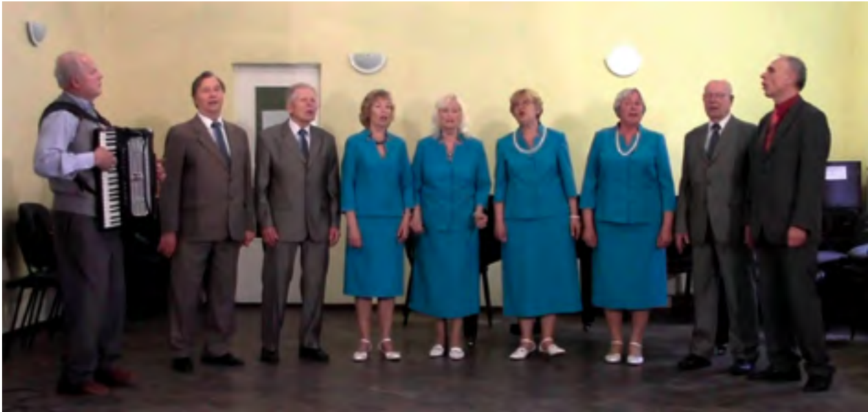
Lauluansambel Viisikera.