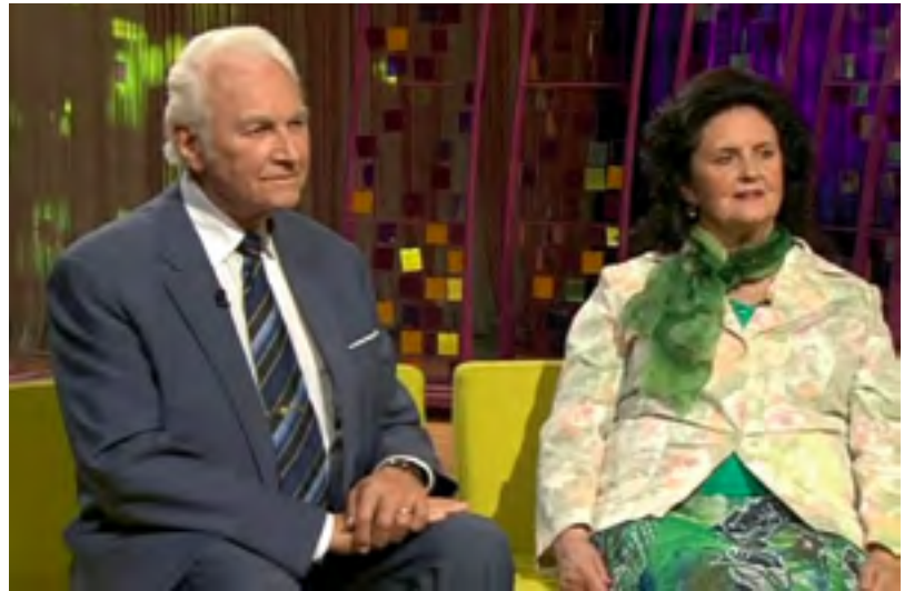
Arnold ja Ingrid Rüütel, 2014.