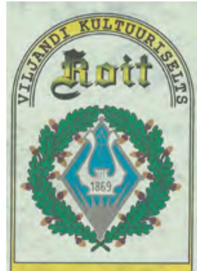
Seltsi logo, 1862.

Esimesel tegevusaastal oli 130 liiget, neist 80 maalt ja 50 linnast. Peeti lauluharjutusi, korraldati pidusid ja kõnekoosolekuid. Esimese kõne pidas J. Kunder vanadest rahvalauludest.