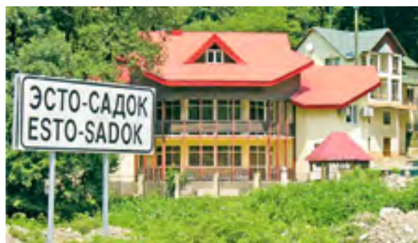
Eesti Aiake, 2007.