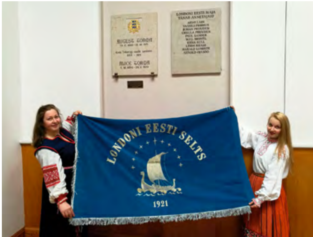
Seltsi lipp.