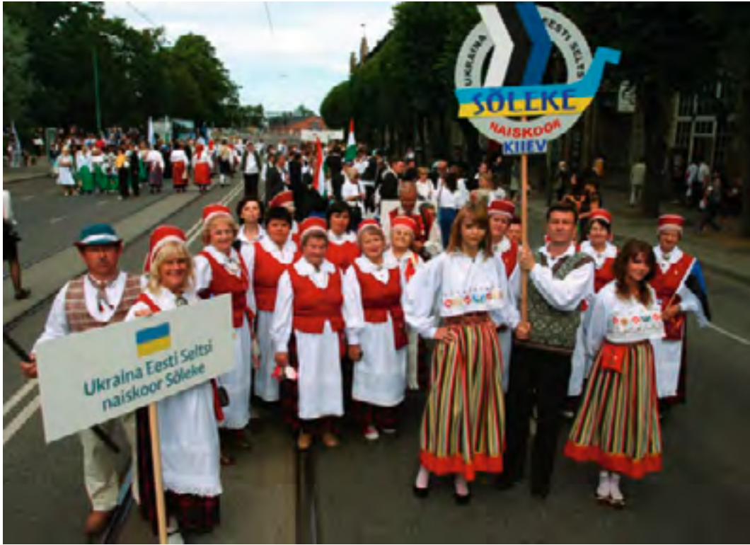
Ukraina-estlased Tallinnas laulu- ja tantsupeol, 2009.

Selts tänab oma tegevuse toetajaid: Eesti Vabariigi Kultuuriministeriumi, Haridus- ja Teadusministeriumi, Välisministeriumi, Eesti Suursaatkonda Ukrainas, Eesti Kultuurkapitali, Eesti Kultuuriseltside Ühendust.