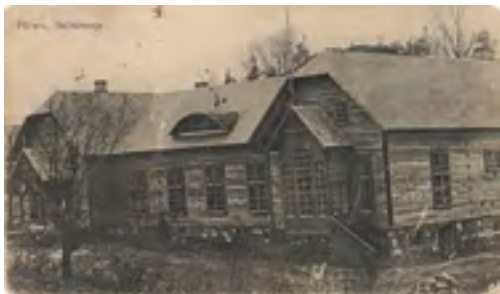
Vana seltsimaja.