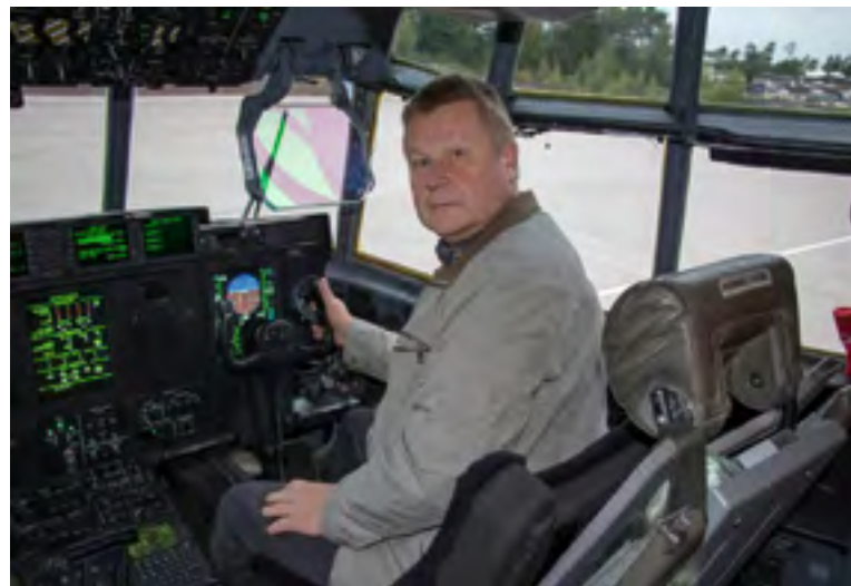
Oliver Manglus autos, 2017.

Valgevene Eesti Selts Pääsuke. Salomennaja 23, Minsk, Valgevene, tel +375 29637 1615, Oma3by@gmail.com, volde52@mail.ru.