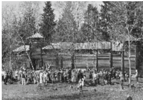
Kassinurme linnuse ehitamine.

Seltsi liikmete hulgas hakkas liikuma mõte leida koht vabaõhuürituste jaoks. Selleks sobis Kassinurme linnamägi koos hiiega, mis oli olnud ka enne II maailmasõda kohaliku rahva kooskäimise kohaks. Siin on korraldatud kihelkonna laulupäevi, vabaõhuetendusi ja pritsimeeste pidusid. Kassinurme linnamägi on olnud ka Tartu gümnasistide meelisväljasõidukohaks. 1989. aastaks olid linnamägi ja hiis võssa kasvanud. Endisi esinemiskohti meenusid mädanenud lavalauad, millest olid läbi kasvanud puud ja põõsad. Kalevipoja silmapesukauss oli umbe kasvanud. Esimene suurem talgupäev korraldati 1989. aasta jüripäeval. Kokku oli tulnud kogu seltsi rahvas. Kaasa aitasid tollased ettevõtted ja majandid: Kaarepere Metsakatsejaam, Jõgeva Metsamajand, Jõgeva MEK ja Jõgeva KEK. Talgutel viibisid ka rahvatantsijad, kes tegid ettepaneku viia Kassinurmes läbi Baltika folkloorifestivali maapäev. See saigi teoks. Talgupäevade vorm on linnamäe korrashoiul jäänud iga-aastaseks ürituseks. Kassinurme linnamäe ja hiie pidev hooldamine ja korrashoid on seltsi mahukamaid ettevõtmisi.