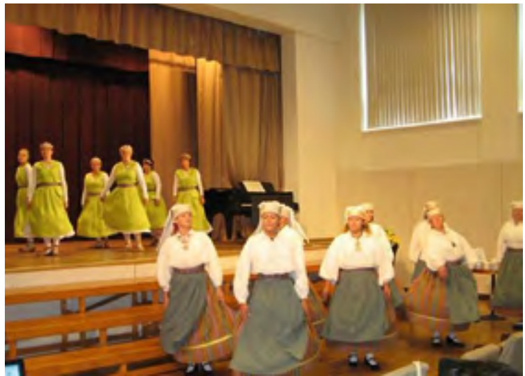
Esinejad 6. augustil 2016 Rakke Kultuurikeskuses kultuuriseltside möttetalgutel.