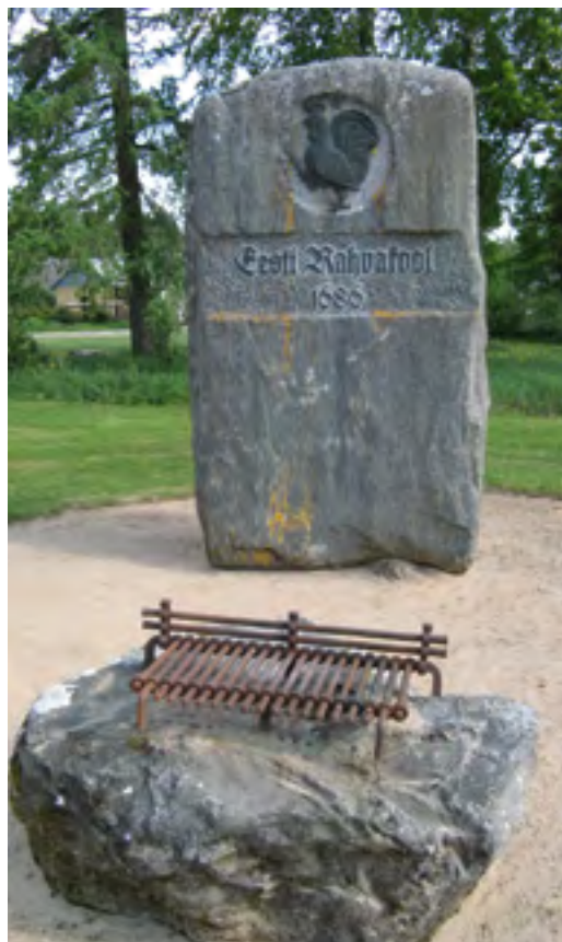
Eesti Rahvakooli Memoriaal Kambjas, avatud 14.06.1987. Skulptor Endel Taniloo.