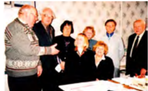
EKSÜ juhatus, 2005.