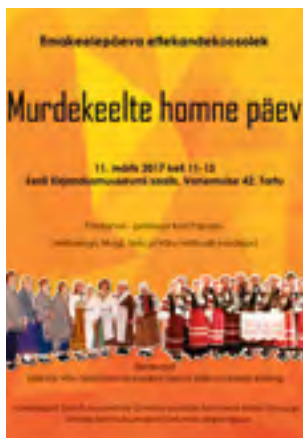
Emakeelepäeva ettekandekoosolek 11. märtsil 2017 Eesti Kirjandusmuuseumis Tartus

Ühing korraldab regulaarselt ettekandekoosolekuid.