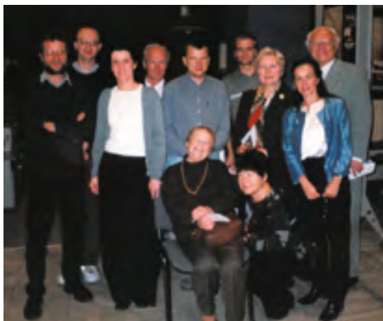
Klubi 25-aastane, 2016.

laululaagrit, mis andis kolm kontserti Praha lossiväljakul, raeplatsil ja kirikus (vt Mäetagused nr 46, lk 171–172). Edukamatest 2017. aasta suurüritustest võiks esile tuua „Eesti suurpidude“ näituse avamist ja ettekannet samal teemal Praha Rahvusmuuseumis ja Poběžovice muuseumis. Seoses Eesti eesistumisega EL-is pidasid klubi liikmed ettekandeid koos küsimustele vastamise ja kontserdiga Tšehhi linnades Pardubices ja Kromeřížis.