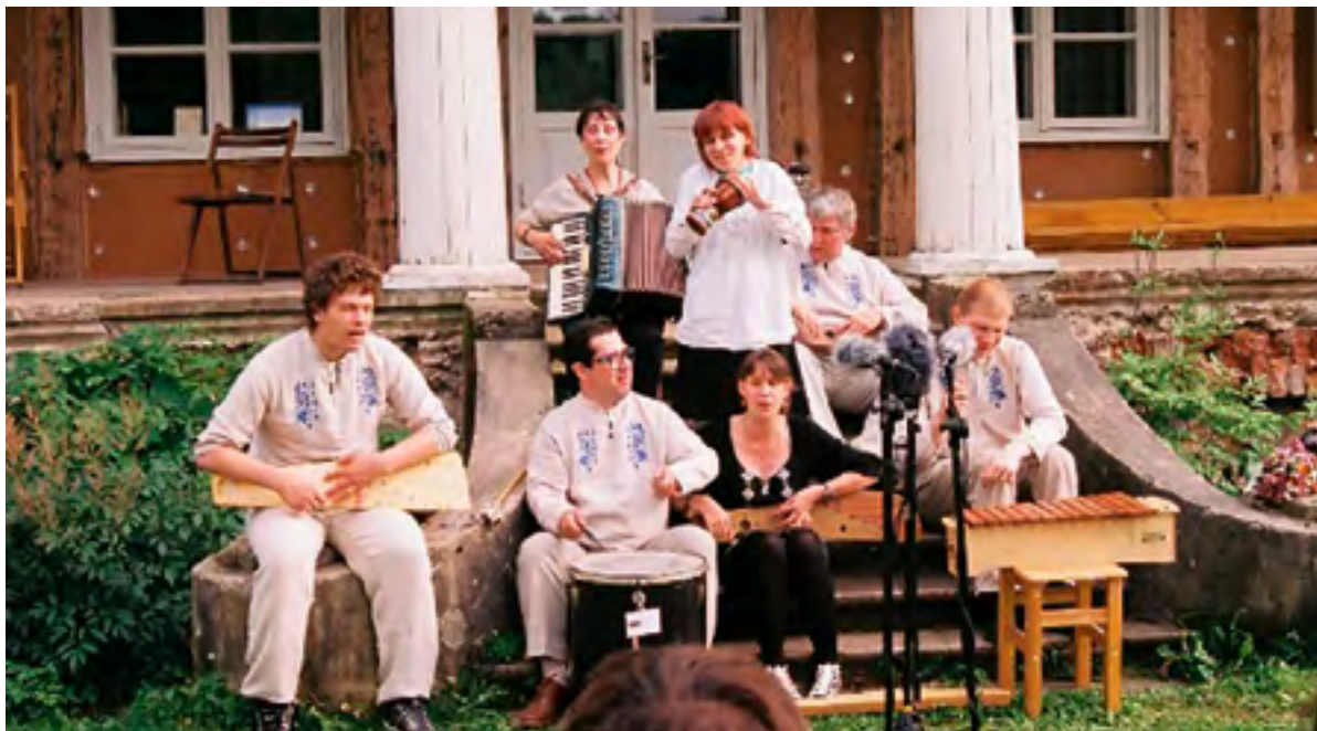
Ansambel Allikabänd, 2017.

2002. aastast on TRAKSi korraldada rahvamuusikapäevad, mis toimusid kas üks või kaks korda aastas kuni 2013. aastani. Varem korraldas neid Triinu Nutt, viimase Liisa Kaha.