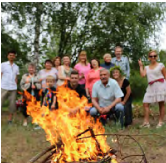
Jaanituli, 2017.

ülevaatustele ja festivalidele. 1999. aastast on koor osa võtnud kõigist Eesti üldlaulupidudest.