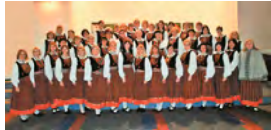
Naiskoor Leelo.

Pärnu Lauluselts Leelo. Kuldse kodu 5-312, Pärnu, tel 5665 6312, 5373 9488, hilja.vainula@gmail.com, tiia.tamm902@gmail.com. FB