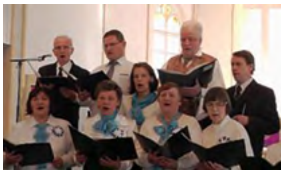
Kõrvuti Eesti Rahvusmeeskooriga esines Peterburi Jaani kirikus ka Peterburi Eesti Kultuuriseltsi laulukoor, 2017.