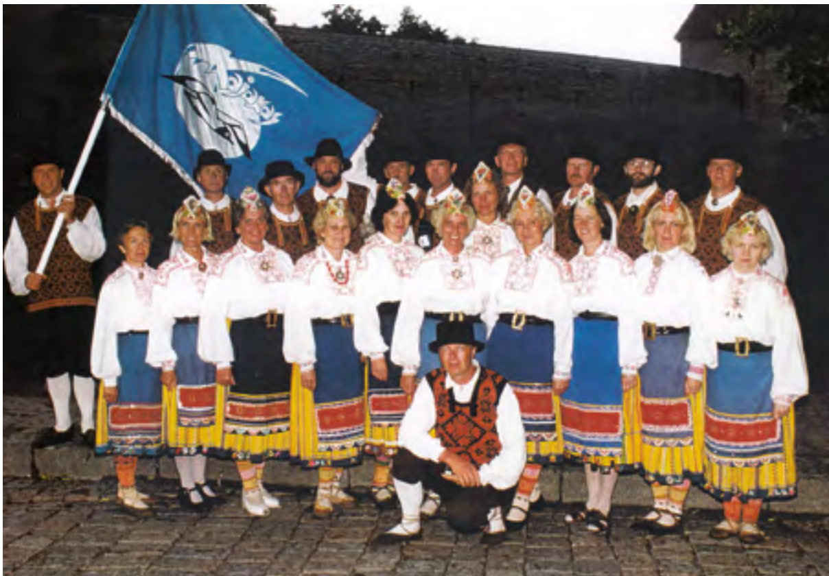
Tantsupidu koos seltsi uue lipuga, 1999.