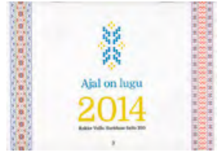
Kalender 2014. Rakke haridusselts 100. Koostanud Aime Kinnep.

Aime Kinnep. Regilaulik "Laula, laula, suukene, liigu linnukeelekene". Rakke, 2016