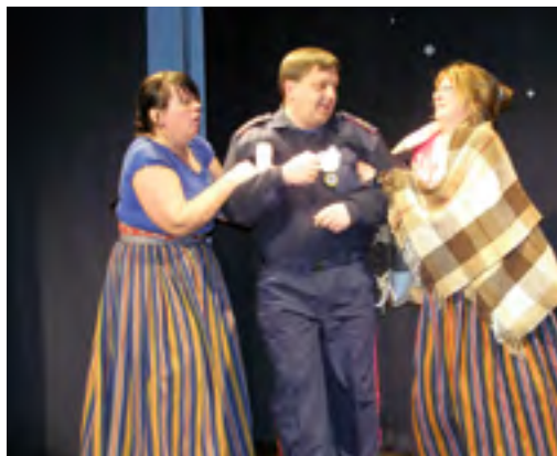
Katkend Juhan Kunderi näidendist „Kroonu onu“.