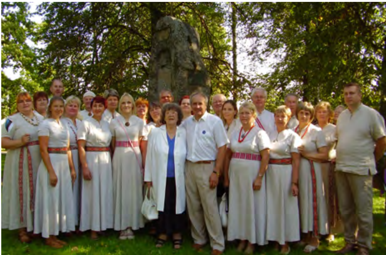
Kanepi segakoor taasiseseisvumispäeval Kanepis 20. augustil 2016.