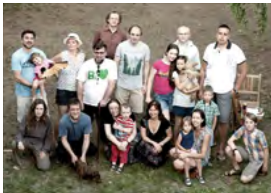
Klubi jaanituli 24. juunil 2016 Praha lähedal.