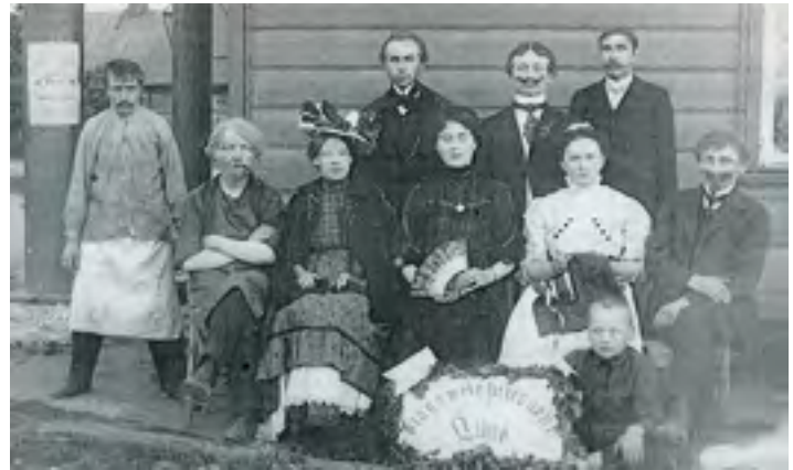
Viru-Nigulas 1907. aastal toimunud etenduse tegelasi.