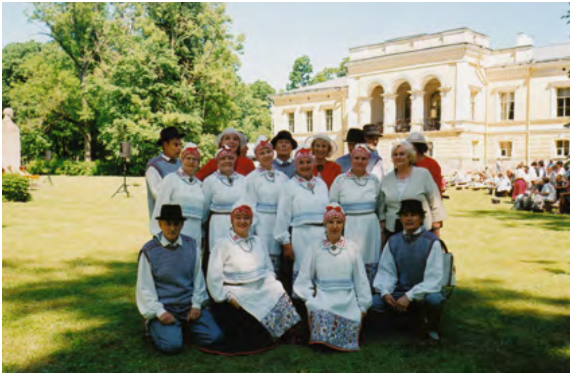
Kajakas EKSÜ suvepeol Muuga mõisas, 2013.

Selts pole unustanud ka oma ansamblit Kajakas. Oleme osalenud kõikidel ansambli juubelikontsertidel (45, 50, 55, 60, 65). Loomulikult oleme kontsertide ja koosviibimistega tähistanud seltsi juubeleid (1997, 2002, 2007, 2012, 2017). Alati oleme peole kutsunud oma sõbrad nii Eestist kui ka välismaalt. Pärnu Kuursaal on korraldatud mitu aastat nn tantsulahinguid, kus tantsurühmad nii linnast kui maakonnast esitavad omaloomingulisi tantse. Osalenud on ka Kajakas.