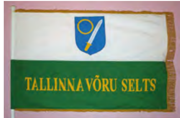
Seltsi lipp.

Tallinna Võru Selts (TVS) on mõeldud koondama Tallinnas ja selle lähikonnas elavaid Võrumaa juurtega inimesi säilitamaks ja loomaks eneseteadvust ja enesemääratlust. Seltsi põhikirjas seisab, et selts taotleb võrulaste eneseteadvuse, koduarmastusele toetuva ühistunde säilitamist, arendamist, levitamist, ajaloolise Võrumaaga (Hargla, Kanepi, Karula, Põlva, Räpina, Rõuge, Urvaste, Vastseliina kihelkond) igakülgset kultuurisidemete hoidmist, võru keele väärtustamist.