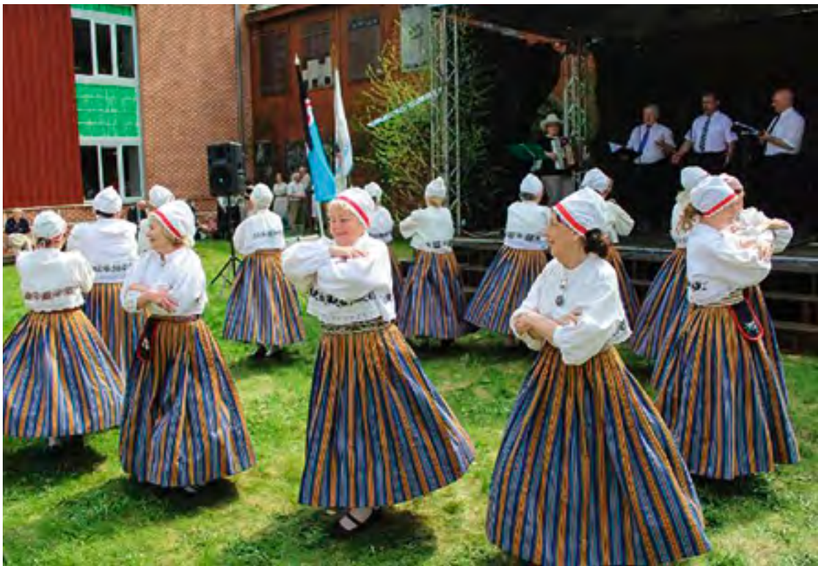
Tantsurühm Värtnad, 2017.

2016. aastal on seltsi liikmete arv kasvanud ajaloo maksimumini – 263 liikmeni (suurem sõjaeelne liikmete arv on