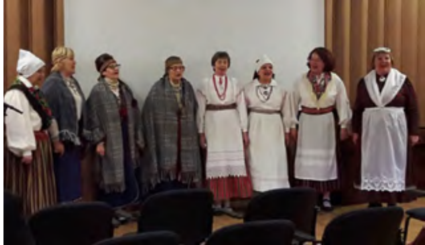
Ansambel Liiso esinemas emakeelepäeval 11. märtsil 2017 Eesti Kirjandusmuuseumis Tartus.