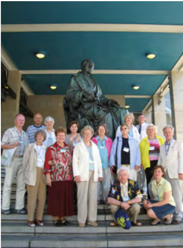
Eesti esperantistid. Universala Kongreso 93, Rotterdam, 24.07.2008.