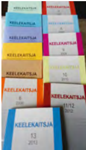
Keelekaitsja, 2001–2013.