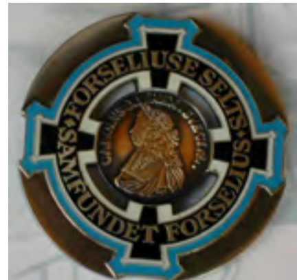
1. järgu medal „Suur Kuldtukat”.

2. Eesti koorilaulu 200. aastapäeva medal (1994). Statuudi preambula: “Tšehhi mõtlejate Jan Husi (1371–1415) ja Jan Amos Komensky (Comenius, 1592–1670) õpetusest juhindunud kristlaste järeltulijad asutasid Saksamaal