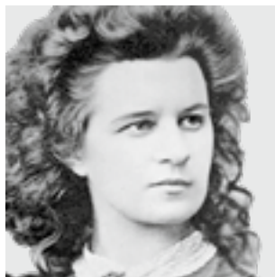
Lydia Koidula (1843–1886), 1867.