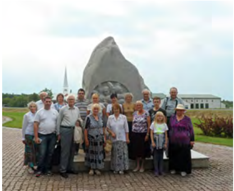
Möttetalgutel osalejad Kambjas, 2015.