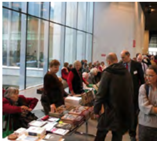
Rakke Valla Hariduse Selts ja Tallinna Võru Selts VI raamatulaadal ERMis, 2016.

Alates 2015. aastast on EKSÜ hakanud rohkem tähelepanu pöörama seltside ja kohaliku kogukonna ajaloo uurimisele, koostamisele, väljaandmisele ja säilitamisele kas käsikirjas või trükituna. Et olla selles tegevuses abiks seltsidele, raamatukogudele ning kohalikele ajaloo huvilistele, on ühenduse esindajad koos Rahvusarhiivi ja ERMi töötajatega külastanud 9 maakonda ja korraldanud seal vastavaid koolitusi. Koolitustest osavõtjad on saanud uusi teadmisi tööks erinevate materjalidega nii Rahvusarhiivis kui ka ERMi kogudes, ühendus on samal ajal tutvustanud oma eesmärke ja tegevust.