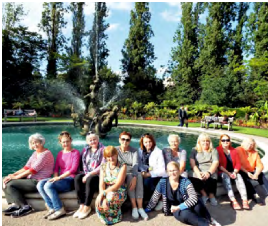
Seltsi aiasõprade klubi liikmed Londoni kuninglikes parkides, 2017.

Kursuslaste lõputöödest on sündinud mitu avalikku näitust. Aiakujunduskursuslaste ettepanekul sai mõni aasta tagasi alguse aiasõprade klubi, mis on muutunud väga populaarseks. Klubi korraldab õppepäevi, rohevahetusi ja aiasõprade õppeekskursioone. Igal suvel saavad teoks külaskäigud Eesti kaunimatesse aedadesse