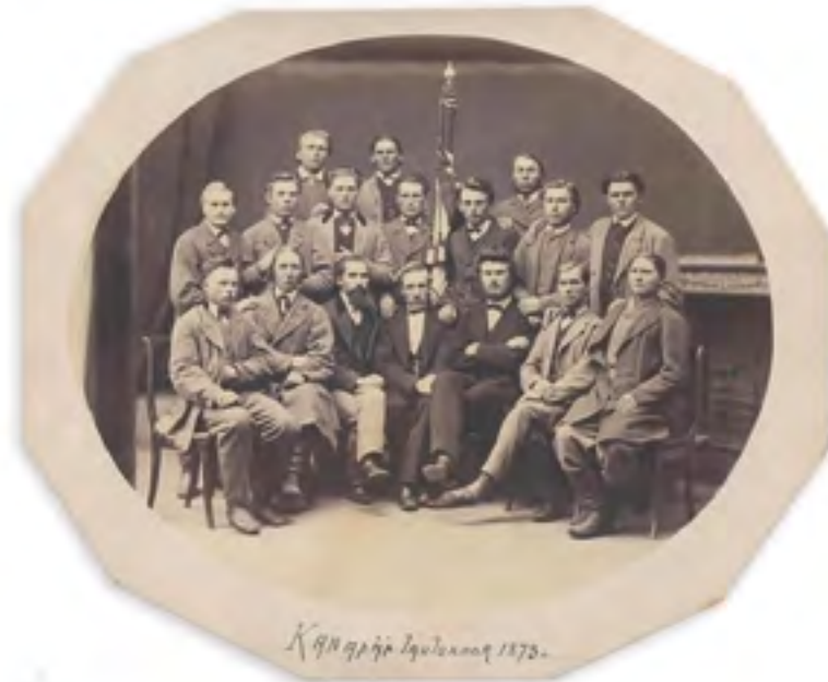
Kanepi laulukoor, 1873.