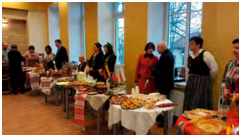
Leivapidu 3. märtsil 2017.