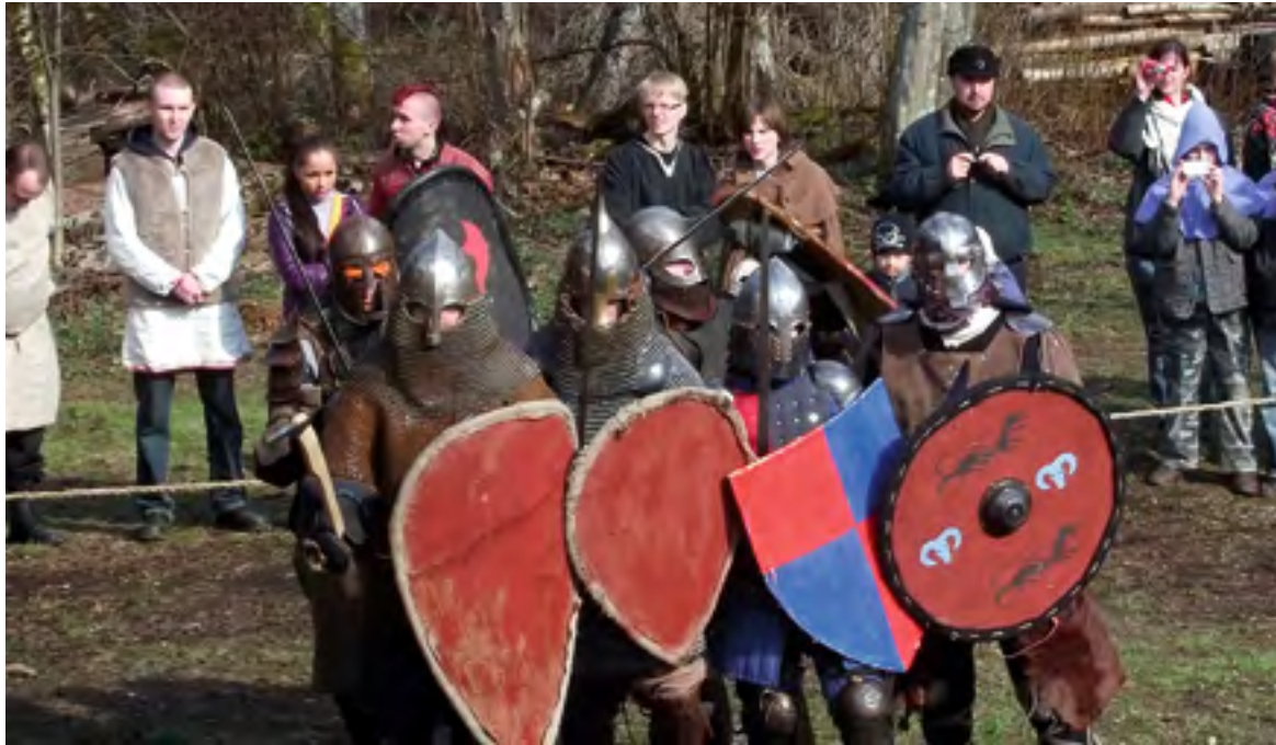
Kassinurme rollimäng.