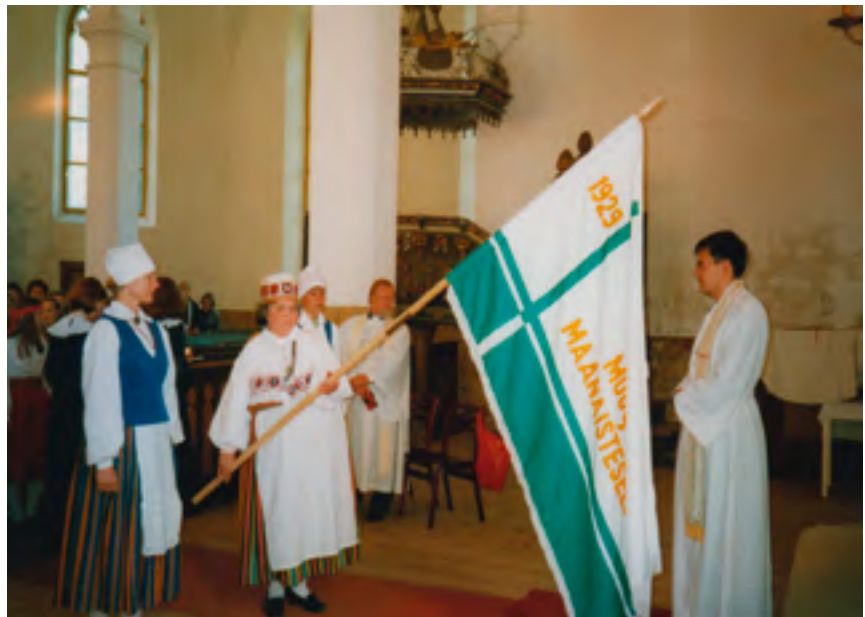
Seltsi lipu õnnistamine.

1998. aastal laskime vana lipu järgi teha seltsile uue lipu, mille õnnistamine toimus Simuna kirikus 24.06.1998, ja vana pitsati jäljendi järgi uue pitsati. 1999. aastal ostime segarahvatantsurühmale uued riided. 2001. aastal korraldati koostöös J. Kunderi Seltsiga Muugas keeleõppelaager „Aita omasid, võta võõraid” krimmieestlaste lastele. Seltsi esinaine eestvõttel anti 2003. aastal välja „Maanaiste laulik“ ja 2004 selle kordustrukk. 2004. aastal koostati seltsi eestvõttel „Muuga piirkonna arengukava 2005–2015“. 2004. aastal leidis PRIA poolt rahastamist projekt „Muuga Maanaisteseltsi Eha ruumide