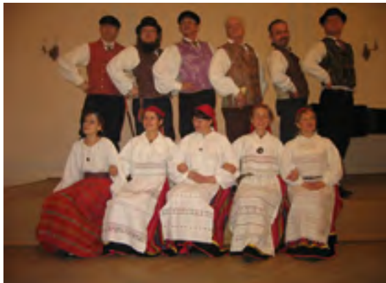
Folkloorirühm Neevo, 2017.