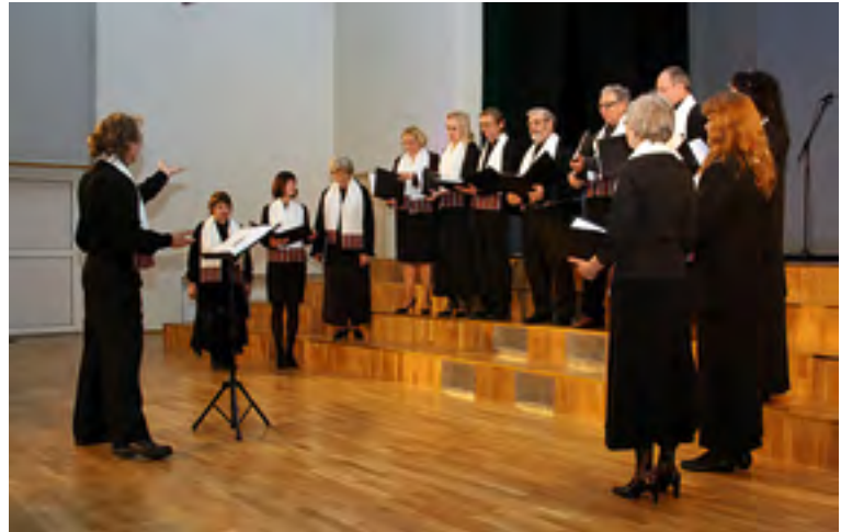
Viljandi segakoor Koit.

Aasta hiljem, Allari 55. sünniaastapäeval 30. juunil 2015, korraldas Kalmetu kooli vilistlaste koor mälestuskontserdi Kalmetu koolimajas. Sel päeval esinesid Kalmetu kooli vilistlaste kammerkoor, Kalmetu kooli õpilased, Koidu