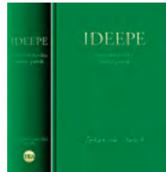
„IDEEPE. Johannes Aaviku ideede päevik“, 2010.