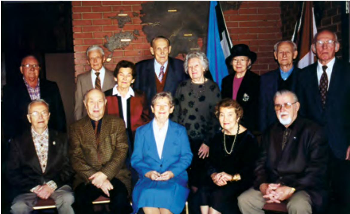
Toronto mulkide eestseisus.

1985, Viljandimaa Mulkide Selts Torontos 1977, Virumaa Virulaste Koondis Torontos 1978, Võrumaa Võrulaste Koondis Torontos 1968, Petserimaal organisatsioon puudus.