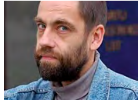
Jaan Malin.