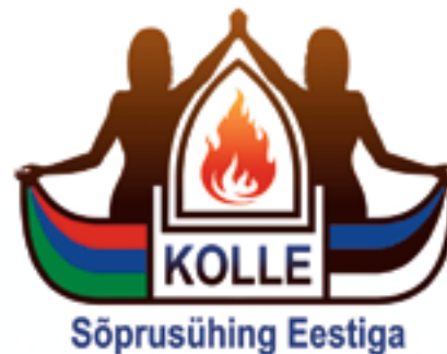
Ühingu logo.

Seltsi asutamiskoosolek peeti 13. mail 2005. Initsiatiivgrupis oli kümme inimest. Kuid juba juunikuus tuli Petrozavodski linna aastapäeva tähistamisele 70 inimest Pärnust – nii täiskasvanuid kui ka lapsi. Tantsukollektiiv esines tunniajalise programmiga linna pealaval. Seltsi ametlik asutamisaeg on detsember 2005, asukoht: Venemaa, Karjala, Petrozavodski linn.