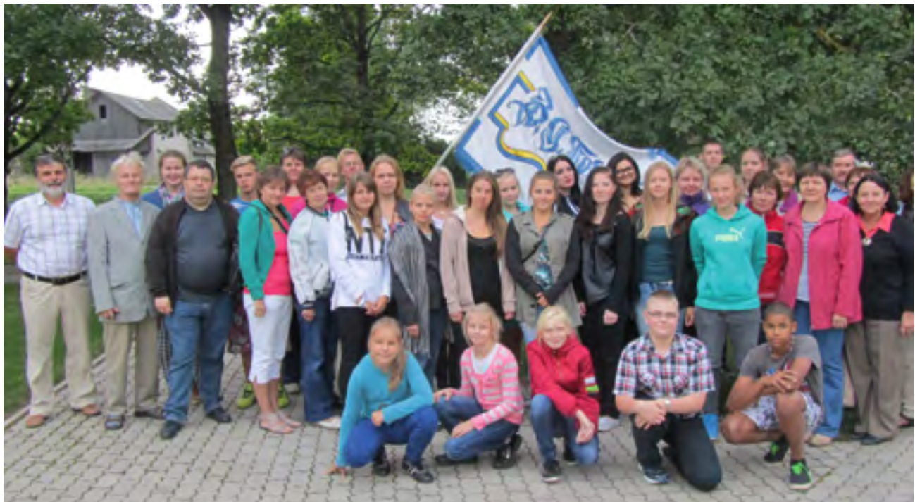
B. G. Forseliuse Seltsi noorte XXV suvekool „Vooremaa väärt kultuur“. Avaüritus Oskar Lutsu Palamuse Gümnaasiumi lipuväljakul, 21.08.2014.

Haridussüsteemis toimub paradigmade muutumine, üleminek didaktiliselt õpetamiselt heuristilisele ehk avastuslikule õppimisele. Tänapäeva koolimudel (õppeained, tunniplaan, õpetajakoolitus) kujunes