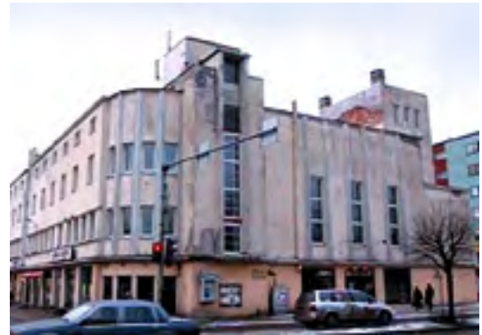
Seltsi maja Nõmmel.

Nõmme Haridus- ja Rahvamajaselts. Pärnu mnt 326, 11611 Tallinn, tel 5623 9523, rahvamajaselts@gmail.com, andro.roos@yhistupank.ee, andro@lkm.ee.