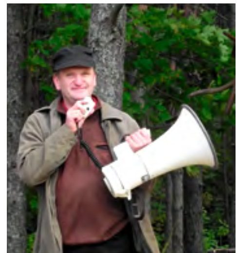
Ain Malm.