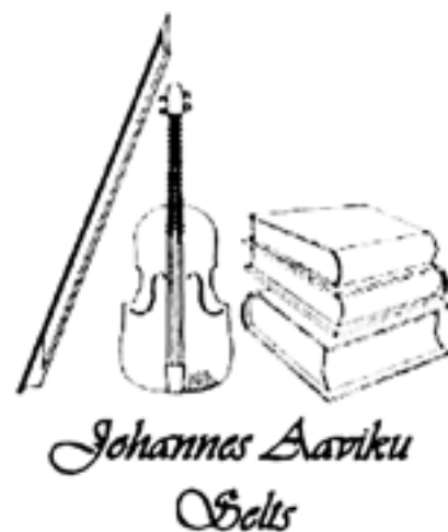
Seltsi logo.

Kõrgajal, 90ndatel tõusis liikmete arv üle 50, mitmeid aastaid on see püsinud 30 juures. Esimehed Jaan Õispuu ja Peep Nemvalts on seltsi tegevusse kaasanud üliõpilasi. Seltsi auliikmeks on valitud keeleteadlasi, kes edendanud Aaviku keeleuudendustöö uurimist või seda ise jätkanud – nagu Paul Saagpakk, kellest saigi esimene auliige aastal 1995. Samuti on auliikmeks valitud teenekaid seltsi töö arendajaid.