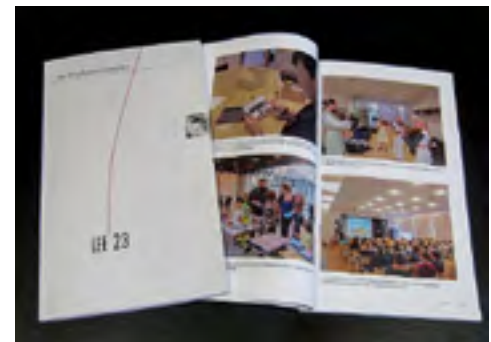
Seltsi aastaraamatu Lee 23. number ilmus 2017. aastal.

2010. aastal sai seltsi koostatuna valmis neljakeelne, 300-leheküljeline ja üle 500 haruldase foto sisaldav „Raadi raamat: pildid möödunud aegadest“. Väljaandes antakse teadlaste kommentaaride ja ohtra pildimaterjali kaudu ülevaade Raadi mõisa ajaloost keskajast tänapäevani. Kogumiku koostamise eesmärgiks oli tuua eestimaalastele