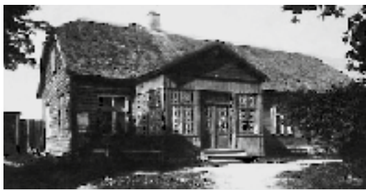
Kanepi rahva ühiselt ehitatud seltsimaja (1887).