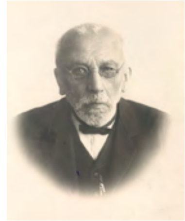
Friedrich Kuhlbars (1841–1924).

Septembrikuu lõpul koliti vastsesse seltsimaja sisse. Seal olid teatrisaal (tõusva põrandaga) ja rõdu kokku umbes 500 inimesele. Lava süvendis paiknes orkestriruum. Oli ka kiirteheitja aparaat, nagu toona kirjutati. Veske tänava poolse peasissepääsu juures oli riidehoid, jalutusruumiks kasutati aiapoolset verandat. Peale selle paiknesid majas piljardituba, keegliruum, einelaud, söögisaal ja soome stiilis mööbliga lugemistuba, lava kõrval