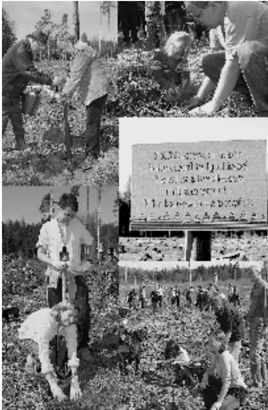
Kassinurmes metsaistutus, miljon puud, 2004.

ning üksik skulptuur „Tasuja”. Kaitseliidu Jõgeva Maleva poolt kingiti metsaseltsile pronksi valatud Muinas-Eesti linnade ja linnuste plaan. Tahvel on kinnitatud linnamäele selleks sobiva suure kivi külge. Kindlustatud on linnamäe varisemisohtlik kagunõlv ning väljakaevamistel kogutud süsinikuproovide põhjal kindlaks tehtud, et esimene puidust kaitserajatis ehitati sinna juba 2000 aastat tagasi. Ajalooliselt tuntud kultusekohana on linnamägi muinsuskaitse all. Koostöös Muinsuskaitseameti Lõuna-Eesti järelevalveosakonnaga hoitakse korras kultusekivide ümbrus, paigaldatakse vajalikud infotahvlid.