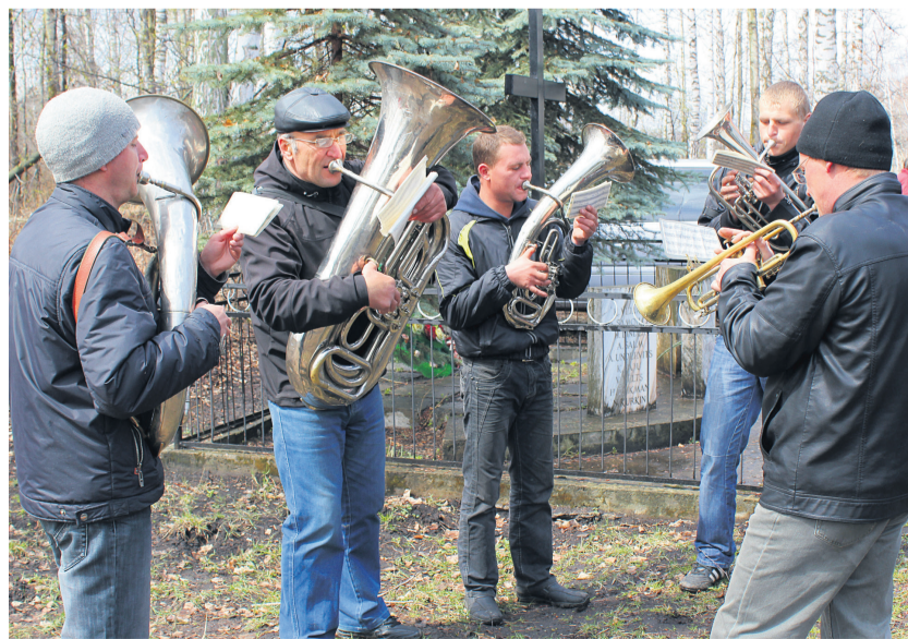
Kaseküla laulikud külaklubis 1993. a talvel.

Ajavahemikul, mil Eesti kuulus ühe liiduvabariigina NSV Liidu koosseisu, suundus eestlasi ka Vene linnadesse õppima või tööle, näiteks Moskvasse, ka Petroskoi eestlaskond tekkis peamiselt Teise maailmasõja-järgsel perioodil.