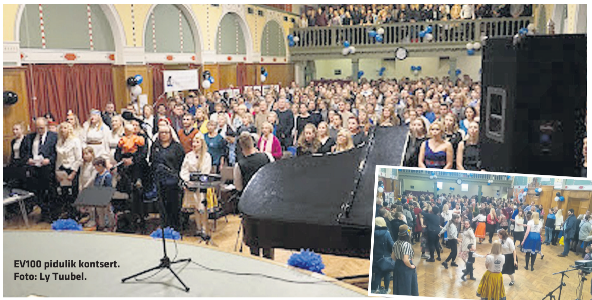
EV100 pidulik kontsert.

EV100 päeva Londonis tähistati suurejooneliselt, üritusi jätkus kahele päevale.