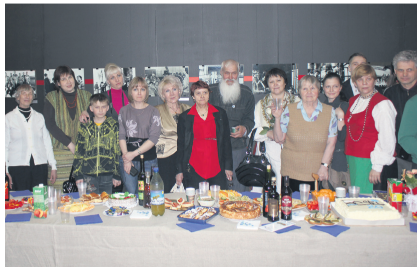
Krasnojarski Eesti Seltsi 20. sünnipäeva tähistamine 2012. a kevadel.

Suur osa Venemaa eestlasi elab riigis hajutatult, kompaktsed kogukondi leidub Peterburis, kus 2002. aasta rahvaloenduse järgi elas 2226, Leningradi oblastis 1409 ja Moskvas 1244 eestlast. Siberis elab eestlasi enim Krasnojarski kraisis. Sealsete kaks suuremat eesti külakogukonda on: Ülem-Suetuk (elanikke u 150) ja Haidak (u 180). Novosibirski oblastis elab eestlasi enim Nikolajevka külas ja Tomski