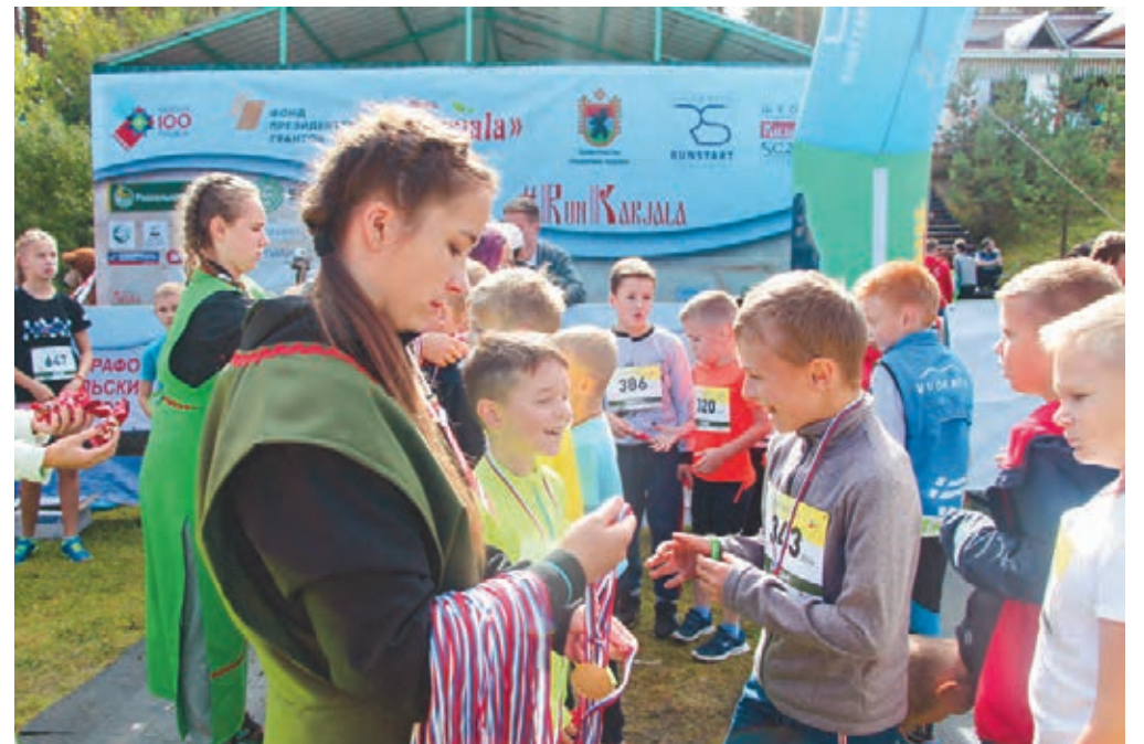
Karjala-puolimaratonissa oli järjestetty myös alaikäisille tarkoitettut 100, 300, 600 ja 900 metrin juoksut. Loppusuoralla osallistujia palkittiin mitaleilla.

Sauvoilla Diane kävelee ylipäänsä viikonloppuisin vähintään 10 kilometriä päivässä. Alussa hän ajatteli, että hänen kiinnostuksensa sauvakävelyn johtuu juuri kiinnostuksesta kilpailuihin, jotka järjestetään useasti eri puolilla maailmaa.