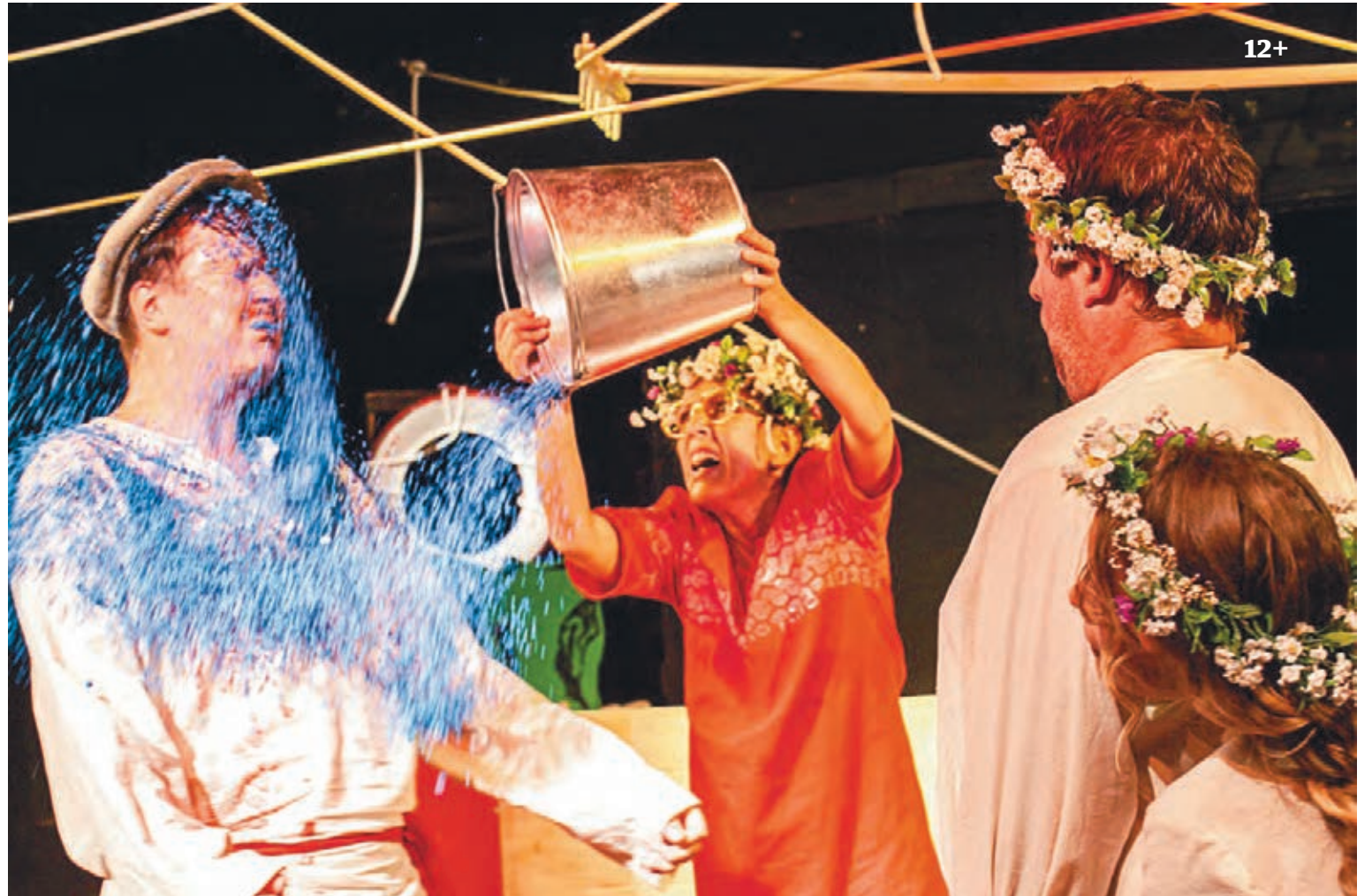
Näytelmän tapahtumat sijoittuvat Kalevalan piiriin kaukaiseen kylään. Kaksi paikallista naisasukasta päättää vaihtaa keskenään miehiään.