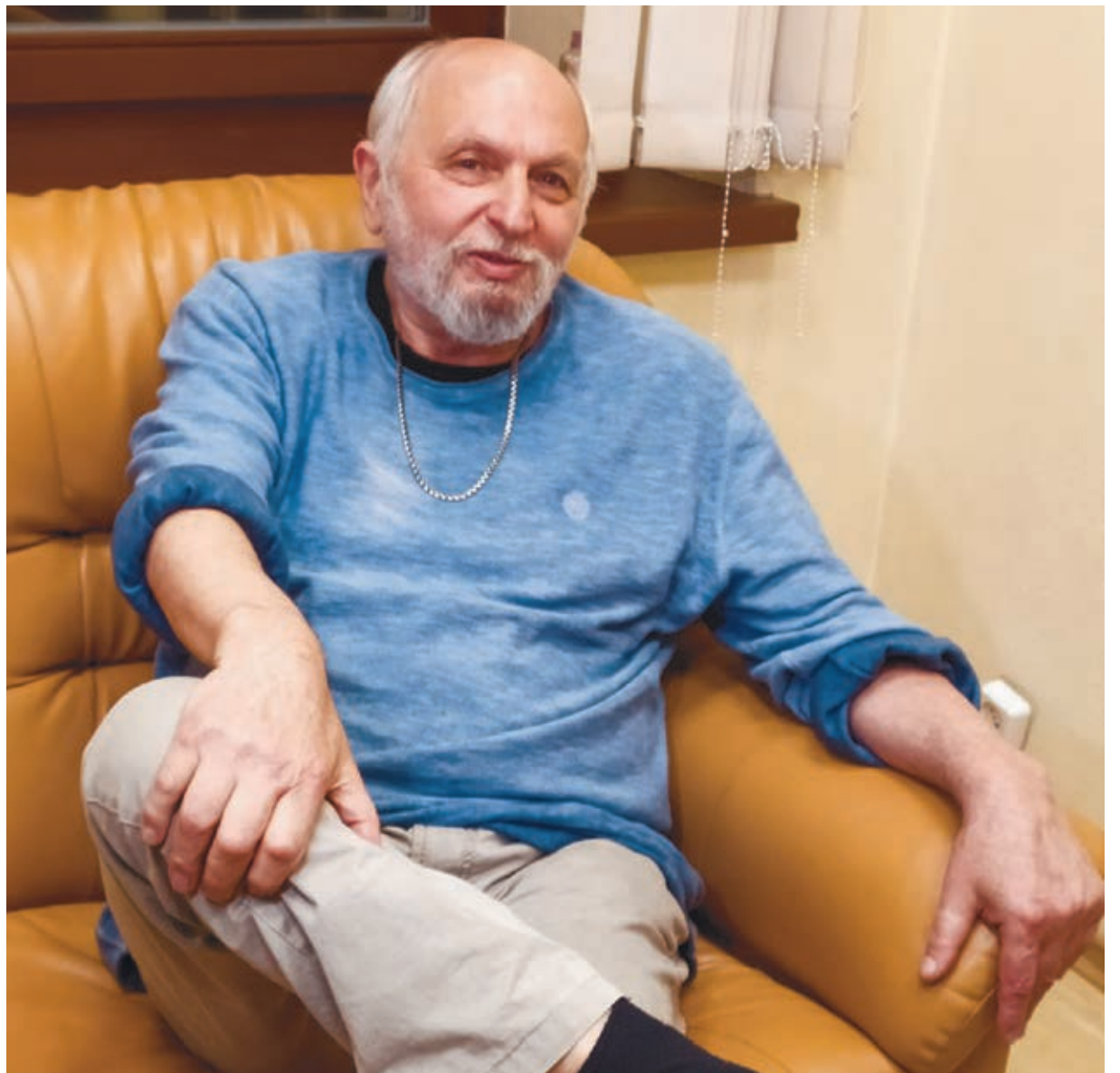
Moskovalainen ohjaaja Kama Ginkas toivoo, että hänen ohjaamansa Kissa kuumalla katolla -näytelmä nähdään Petroskoissa.