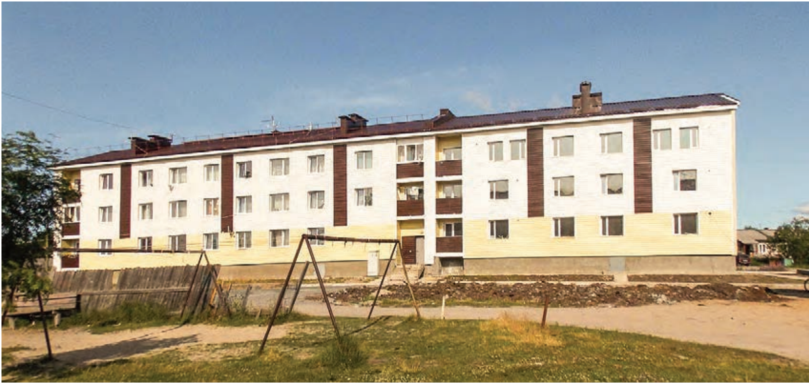
Pari viikkoa ennen lämmityskauden alkua Papinsaarella ei ole aloitettu lämmityskeskuksen rakennusta. KarelKommunEnergO Oy vakuuttaa, että lämmityskausi alkaa taajamassa ajoissa.