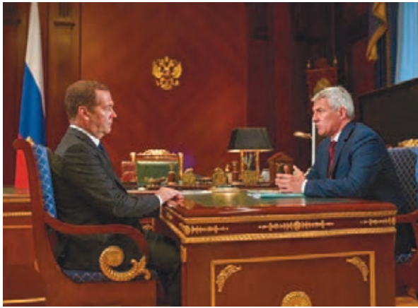
Karjalan päämies Artur Parfentšikov on kertonut Venäjän pääministerille Dmitri Medvedeville tasavallan sosiaalitaloudellisen kehityksen tuloksista tammi-heinäkuun ajalta.