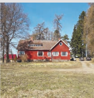
Lars Sonckin kartanorakennus Kurkijoen kylässä.

Matkasta on kuulunut jo muutama kuukausi, ja nyt kannan mukana kirjan Sonckin arkkitehtuurista.