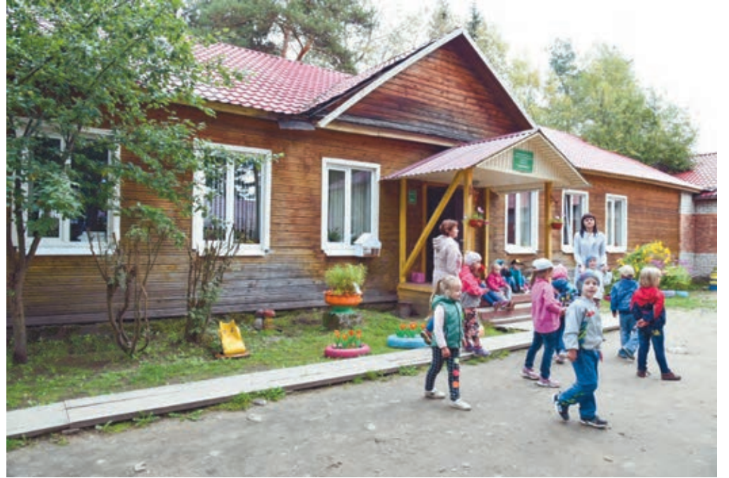
Nyt Tšalnan päiväkotihoidossa on 129 lasta ja jonotuslistalla on 106.

– Tšalnassa suunnitellaan terveyspalvelujen parantamista. Taajaman asukkaat kuuluvat Präsän piirisaira-