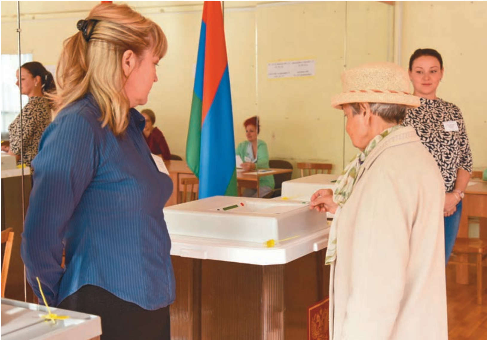
Kuntavaaleihin osallistui Karjalan piireissä 15,5 prosenttia ja Petroskoissa 8,5 prosenttia äänioikeutetuista. Näitä oli kaikkiaan yli 94 000.

Kuntavaaleissa tietoa kansanedustajaehdokkaista oli useilla äänestyspaikoilla niin venäjän kielellä kuin kansalliskielillä.