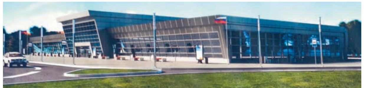
Uusi lentoterminaaliksi valmistuu ensi vuonna. Se on suurimpia Karjalan vuoteen 2020 ulottuvaan kehitysohjelmaan kuuluvia rakennuskohteita.

Ministerin mukaan urakoitsija suoritti lentoterminaalin ensimmäisestä rakennusvaiheesta hyvin lyhyessä ajassa siis tasan kuukaudessa. Kohteen rakennus- ja asen-