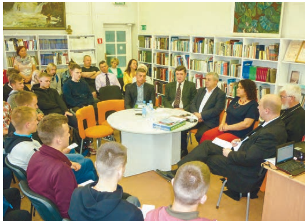
Terrorismin uhkaa ja terrorismin ja ekstremismin ennakkoehkäisyä Karjalassa käsiteltiin kokouksessa Petroskoin autoliikenneopiston opiskelijoiden kanssa.

– Elokuun lopussa terrorismipropagandasta tuomittu Karjalan asukas vapautui vankilasta. Ensi vuonna vapautuu mies, joka suunnitteli klubin räjäytystä Petroskoissa vuonna 2011. Tulemme valvomaan heitä kuin muita terrorismista vangittuja kahdeksan vuoden mittaan, Kudrjajtsev kertoo. KS