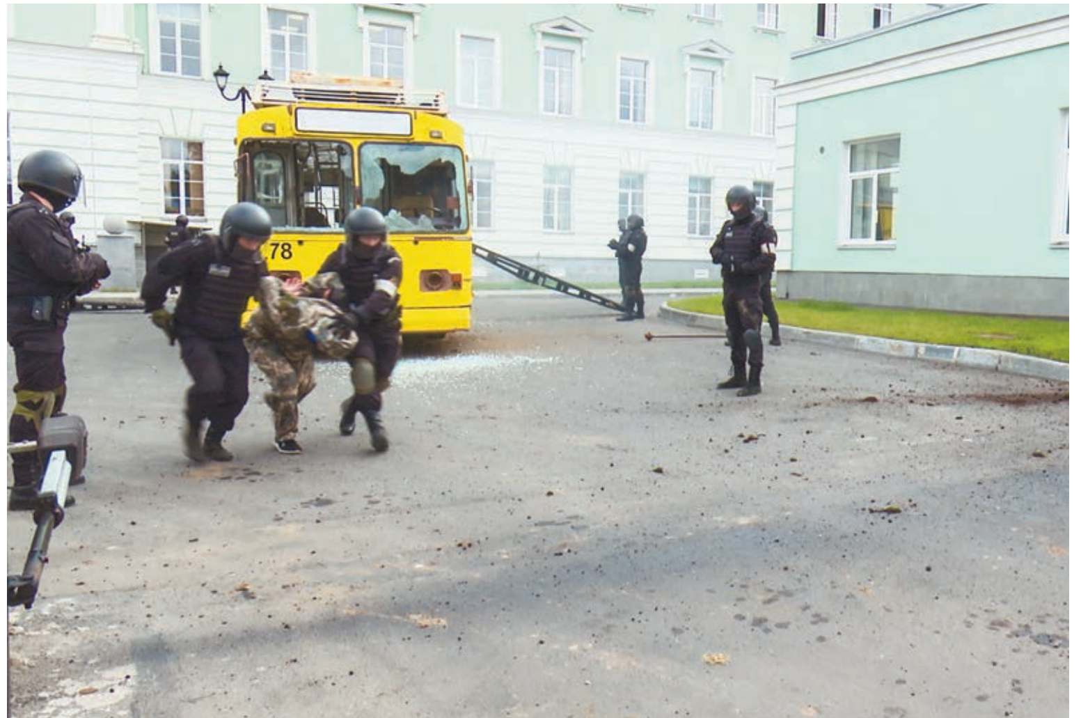
Terrorismin vastaisia harjoituksia pidetään säännöllisesti Karjalan tasavallassa. Yhdet viimeisistä olivat elokuussa presidentin kadettiopistossa Petroskoissa.

Internetin aikana kaikki maat ovat terrorismin uhan edessä. Viime vuosina nuoria ihmisiä on värvätty ekstremisti- ja terroristijärjestöihin, esimerkiksi Isisiin, pääasiallisesti