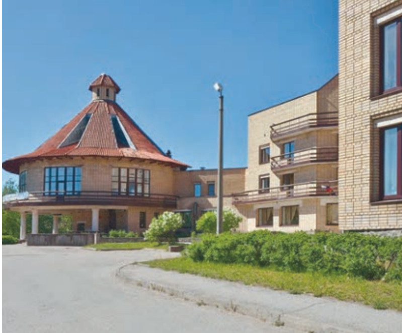
Yksityisyrittäjä on kunnostanut Aunuksen keskustassa sijaitsevan hotellirakennuksen, joka kuuluu piirikeskuksen arkkitehtonisiin nähtävyyksiin.