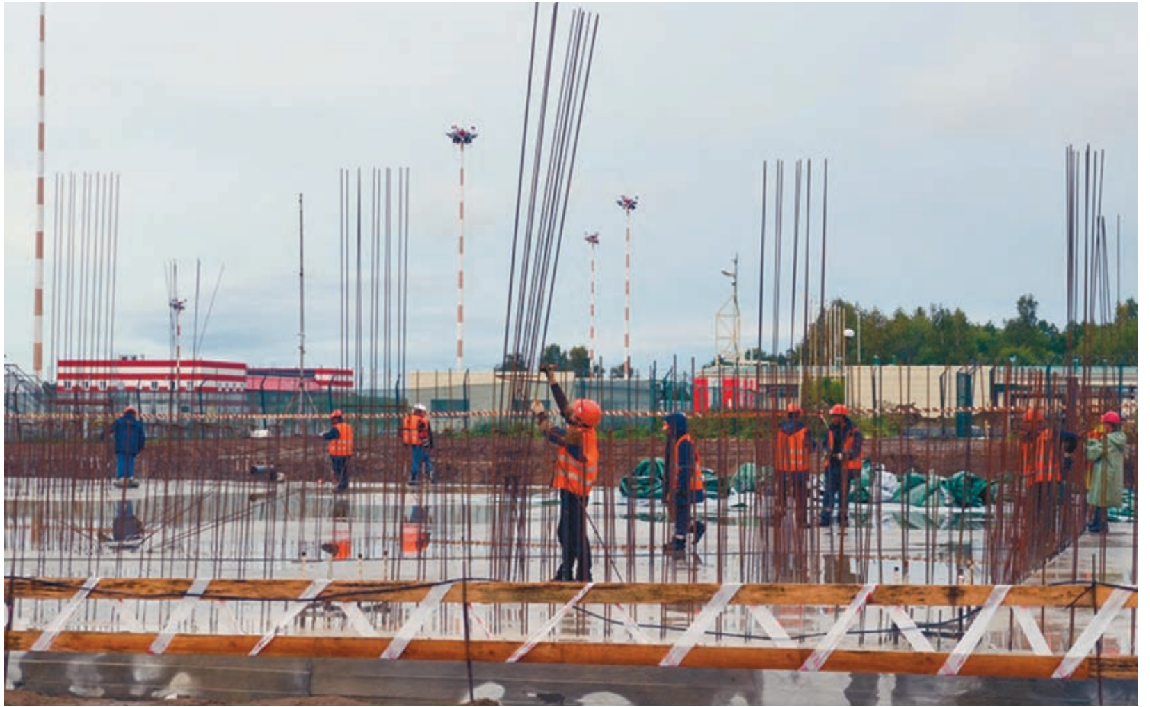
Besovetsissä on viety loppuun tulevan lentoterminaalin perustuksen tekemisen.

Kaksi urakointiliikettä jatkaa teiden korjausta Petroskoissa. Sadesäänä tueurakoitsijat jyrivät pois vanhan päällysteen ja valmistelevat pohjaa uudelle asfaltille. KS