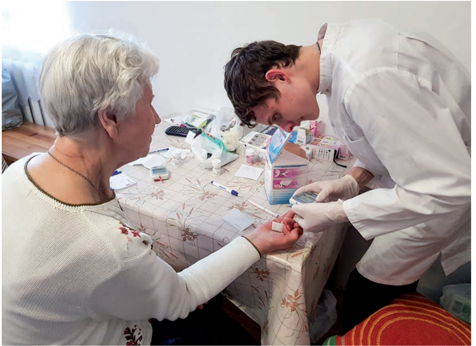
Maalaislääkäri-ohjelmassa maaseudulle muuttavalle lääkärille maksetaan miljoona ruplaa ja välskärille puoli miljoonaa ruplaa apurahaa.