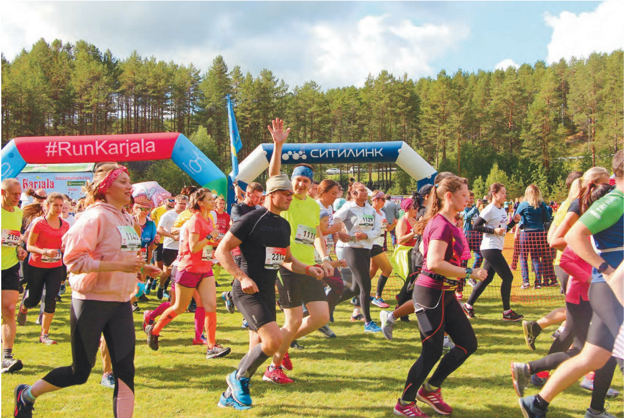
Viime vuosina venäläiset ovat harrastaneet juoksua hurjasti. Satoja juoksijoita tuli eri puolilta Venäjää Karjala-puolimaratonille viime lauantaina Prääsään.