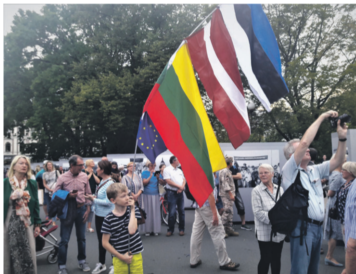
Kohalik poiss nelja lipuga oli fotograafide ja kaamerameeste lemmik.

Minu rahvuslik ärkamine oli selleks ajaks toimunud, aga Balti ketti ma endale teadmata põhjusel koolitüdrukuna ei jõudnud.