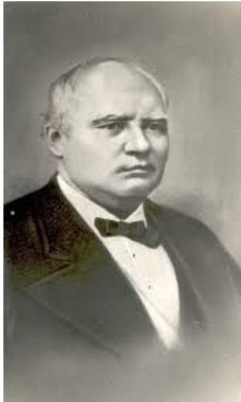
C. R. Jakobson 1841-1882