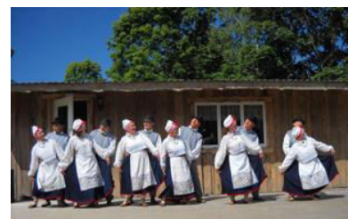
Rahvuskultuuri Selts KAJAKAS