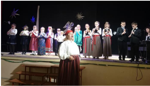
Septembris.2016 osales perekonnaansambel "Õunake" Tveri Botaanikaaias korraldatud "Lõikusepeol". Mihklipäev -eestlaste lõikusepidu.