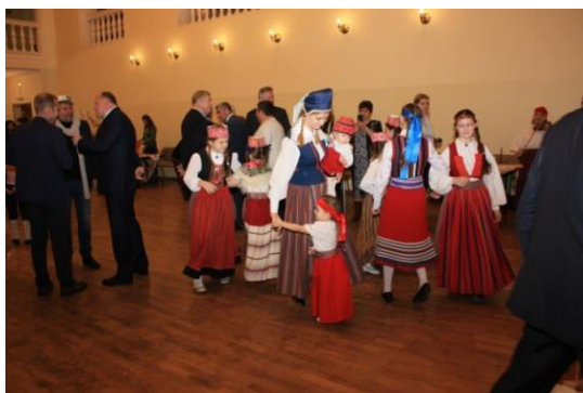
Novembris .2016 osalesid pereansambel "Õunake", seltsi liikmed, sõbrad-partnerid Rahvaste ühtsuse päeva raames korraldatud pidustustel.