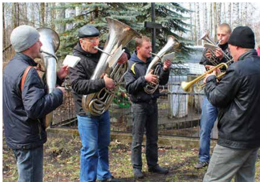
Kaseküla laulikud külaklubis 1993. a talvel.

Ajavahemikul, mil Eesti kuulus ühe liiduvabariigina NSV Liidu koosseisu, suundus eestlasi ka Vene linnadesse õppima või tööle, näiteks Moskvasse, ka Petroskoi eestlaskond tekkis peamiselt Teise maailmasõja-järgsel perioodil.