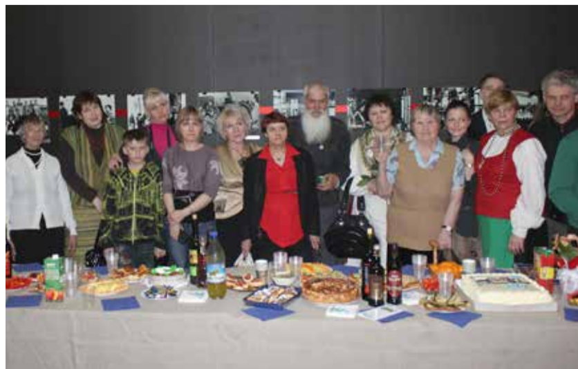
Krasnojarski Eesti Seltsi 20. sünnipäeva tähistamine 2012. a kevadel.

Suur osa Venemaa eestlasi elab riigis hajutatult, kompaktsed kogukondi leidub Peterburis, kus 2002. aasta rahvaloenduse järgi elas 2226, Leningradi oblastis 1409 ja Moskvast 1244 eestlast. Siberis elab eestlasi enim Krasnojarski kraisis. Sealsete kaks suuremat eesti külakogukonda on: Ülem-Suetuk (elanikke u 150) ja Haidak (u 180). Novosibirski oblastis elab eestlasi enim Nikolajevka külas ja Tomski