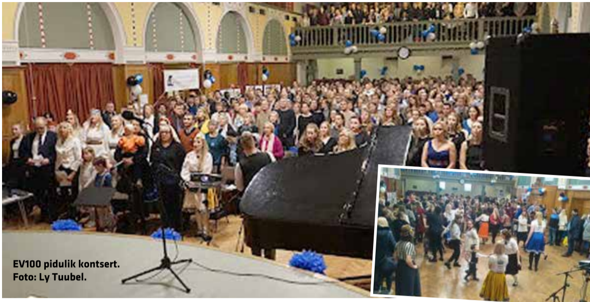
EV100 pidulik kontsert.

EV100 päeva Londonis tähistati suurejooneliselt, üritusi jätkus kahele päevale.