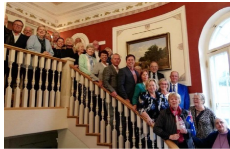
ÜEKN täiskoguist pärast 21. septembri koosolekupäeva lõppu Kurma mõisas. Foto: Aho Rebas (2019)

Ülemaailmse Eesti Kesknõukogu (ÜEKN) täiskogu koguneb tavaliselt kevadel. Seekordne koosoleku aeg, 20.-21. september, oli ajastatud suurpõgenemise 75. aastapäeva mälestussündmustega. Nõustuti, et nüüd on rohkem kui kunagi varem oluline koostöö nii riikide kui inimeste vahel ja ühisosa otsimine ja leidmine hoolimata erimeelsustest, sest kunagi varem pole Eesti valitsuse poolt diasporaa suhtes olnud sellist huvi ja potentsiaali koostegevuseks, nagu seda on praeguses valitsuse loodud globaalse Eesti koostöökomisjonis.