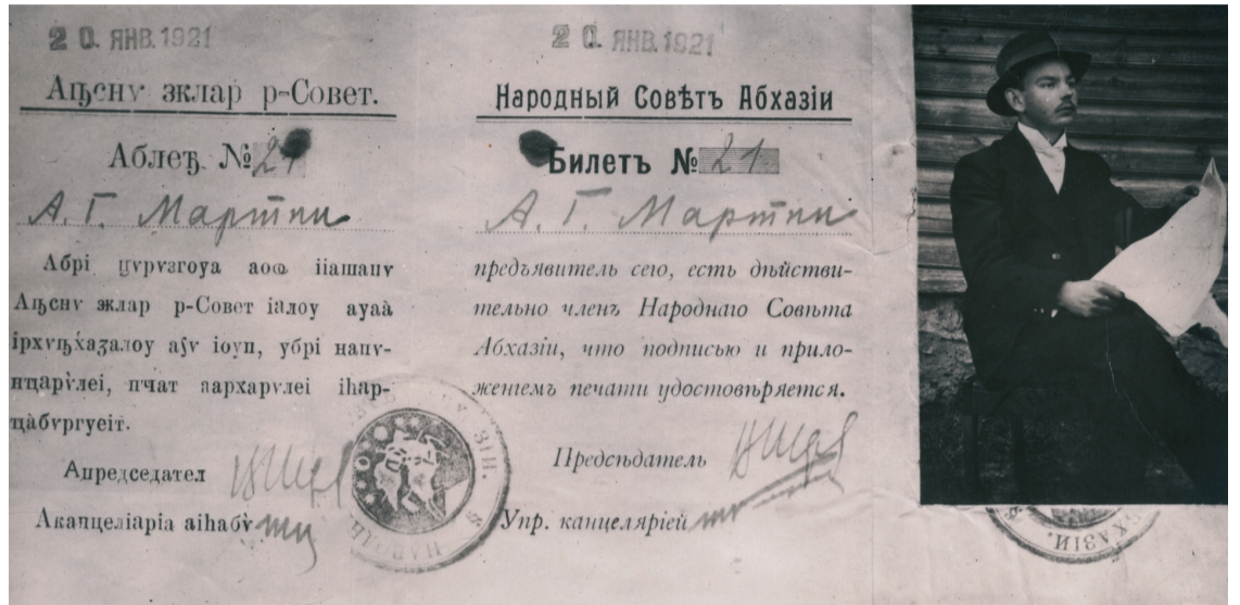
ЧЛЕНСКИЙ БИЛЕТ АВГУСТА МАРТИНА