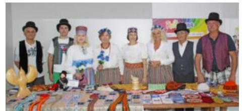
Soome-Ugri Kultuuride Festival Krimmis - 2023

8. septembril Krimmis Alushtas toimunud VII soome-ugri rahvaste festival kujunes tõeliselt pidulikuks. Festivali galakontsert toimus Alušta sanatooriumis “Slavutich”. Osalesid filharmoonia solistid Mordva ja Mari Eli vabariikidest ning vokaal- ning tantsu kollektiivid, üksikesinejad Krimmi ja Sevastopoli erinevatest paikadest.